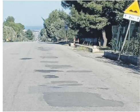
STRADA TRANI-CORATO Necessari lavori urgenti di manutenzione

«A disposizione dell'amministrazione per un supporto tecnico nei tavoli di propria competenza»